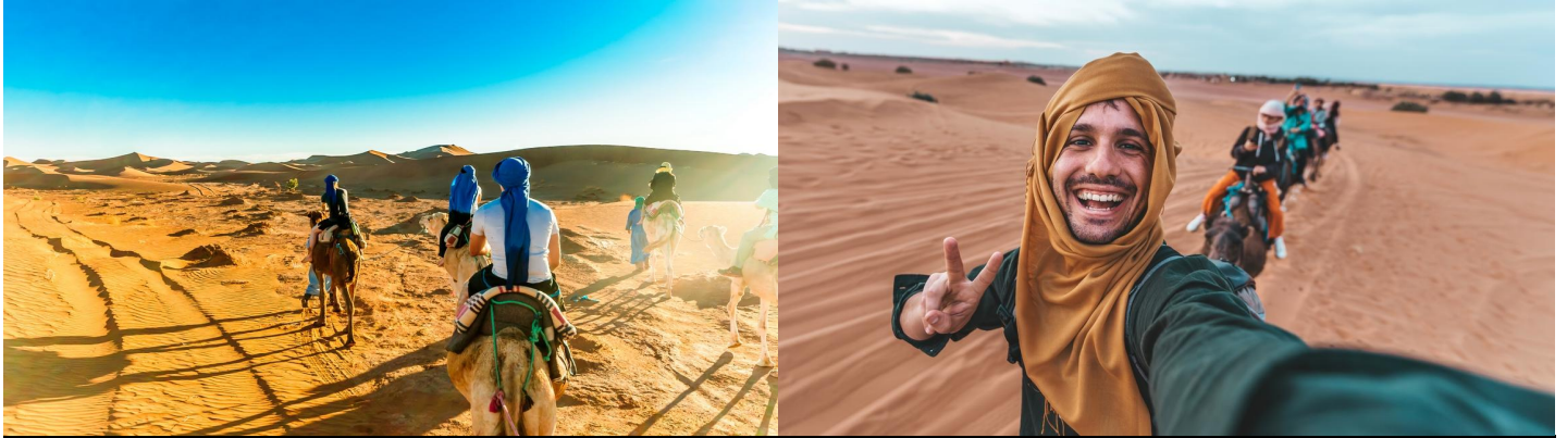
Dag 8: Ouarzazate - Marrakech

Ingedeeld door UNESCO als Werelderfgoed is het ongetwijfeld de meest indrukwekkende "Ksar" van heel Zuid-Marokko. Daarna verder naar Skoura.