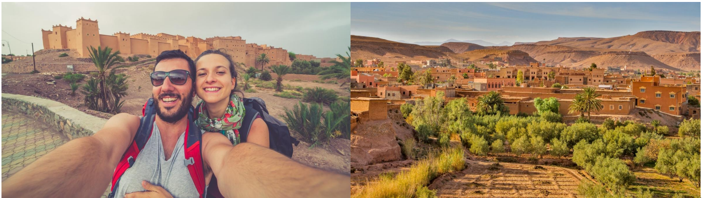
Dag 9: Marrakech - Brussel

Aankomst in Marrakech aan het einde van de namiddag.