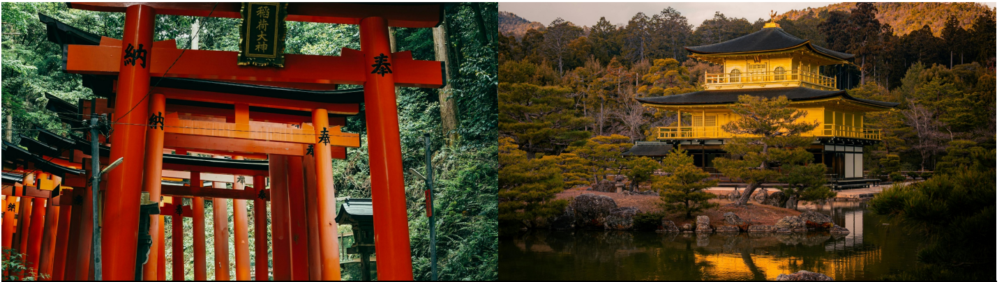
Dag 8: Fukui (Eiheiji Temple Stay)

Vandaag stuur je de auto richting de ruige kust van de Japanse Zee naar de prefectuur Fukui. Hier verschuilt zich in de dichte dennenbossen en diepe bergen de Eiheiji-tempel, een van de belangrijkste hoofdkwartieren van het Soto-zenboeddhisme. Dit is de plek waar je de hectiek van de moderne wereld volledig achter je laat voor een diep spirituele Temple Stay.